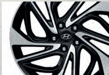
Lazang hợp kim 19 inch thể thao