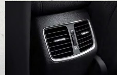
Cửa gió điều hòa hàng ghế sau