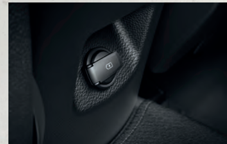
Cổng USB hàng ghế sau