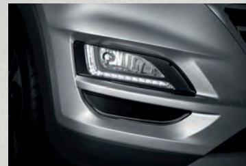
Dải đèn LED ban ngày sắc sảo