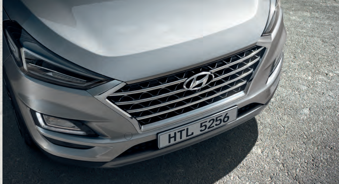
Lưới tản nhiệt dạng thác nước Cascading Grill ấn tượng