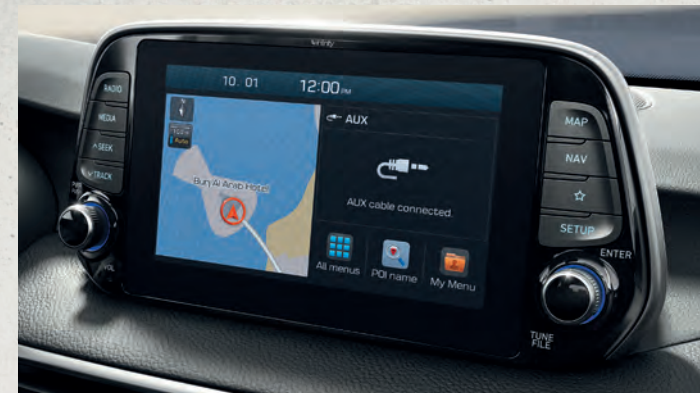
Màn hình cảm ứng 8 inch

Không gian nội thất rộng rãi và công nghệ tiện nghi bên trong chiếc xe Hyundai Tucson có thể đáp ứng mọi nhu cầu và sở thích của bạn