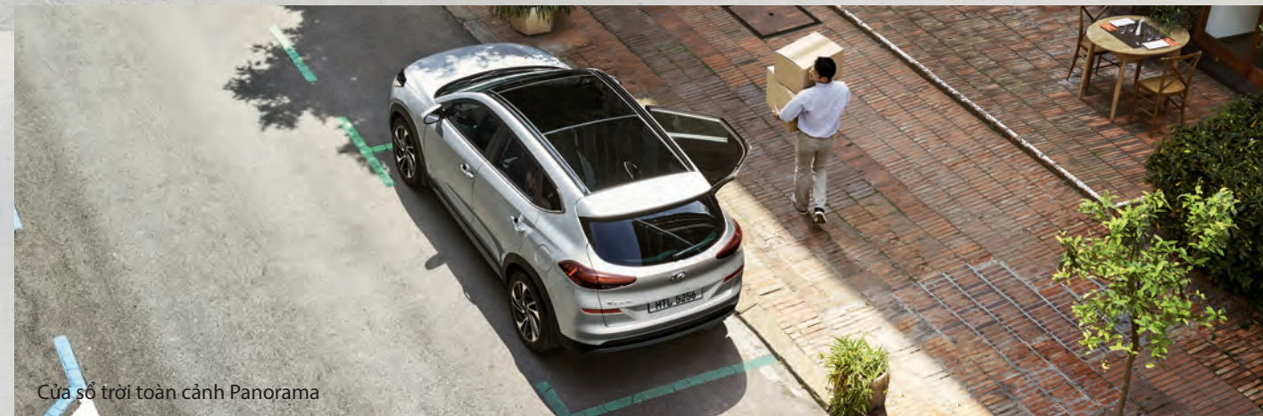
Cửa sổ trời toàn cảnh Panorama