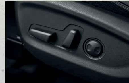
Ghế lái chỉnh điện 10 hướng