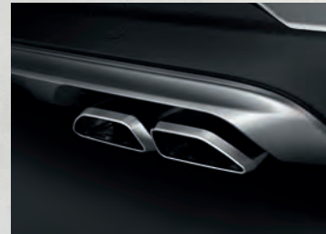
Ống xả kép