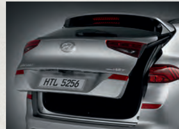
Cốp điện thông minh