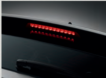
Đèn phanh trên cao