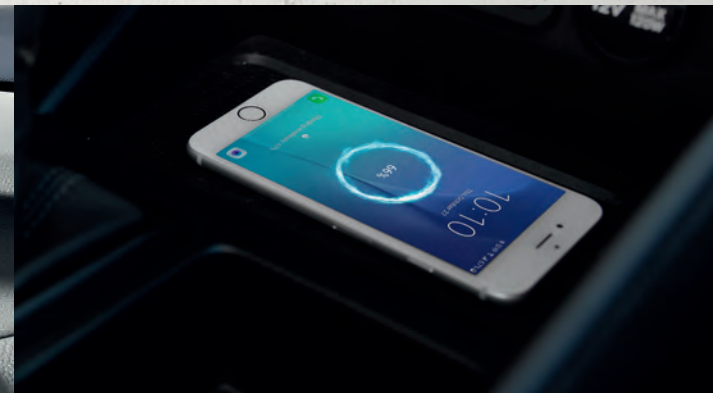
Sạc điện thoại không dây chuẩn Qi