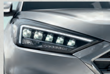
Cụm đèn pha Full LED mạnh mẽ